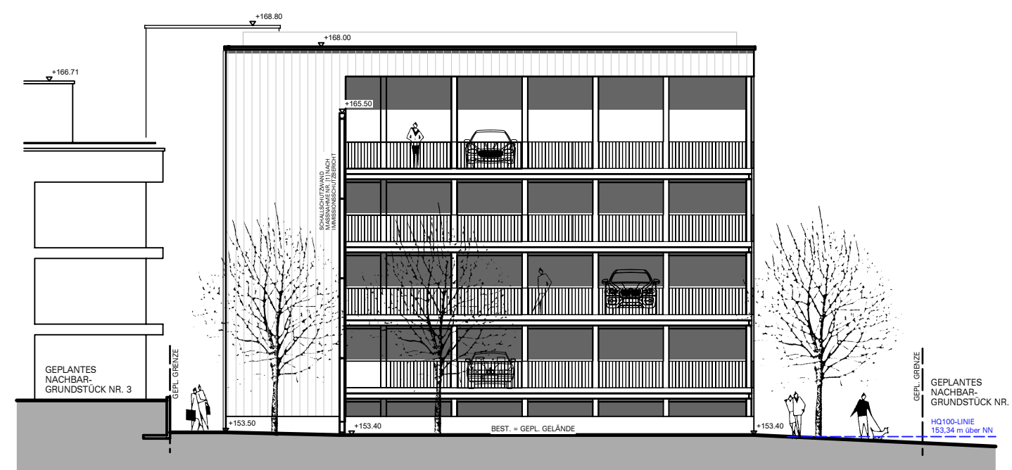
ANSICHT VON SÜDEN - GEBÄUDE G4