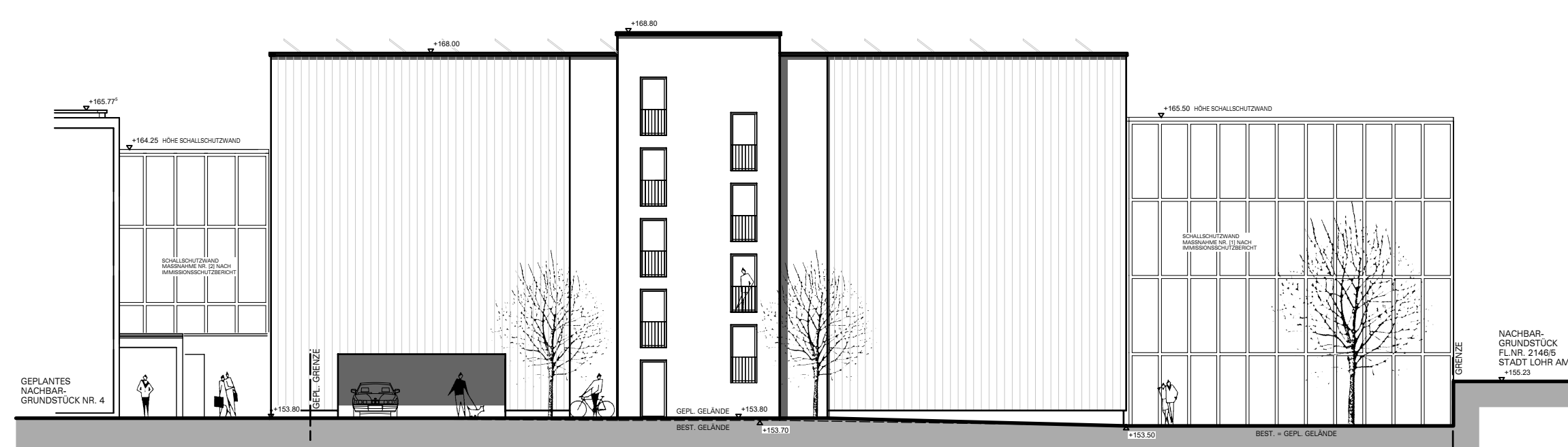
ANSICHT VON WESTEN - GEBÄUDE G4