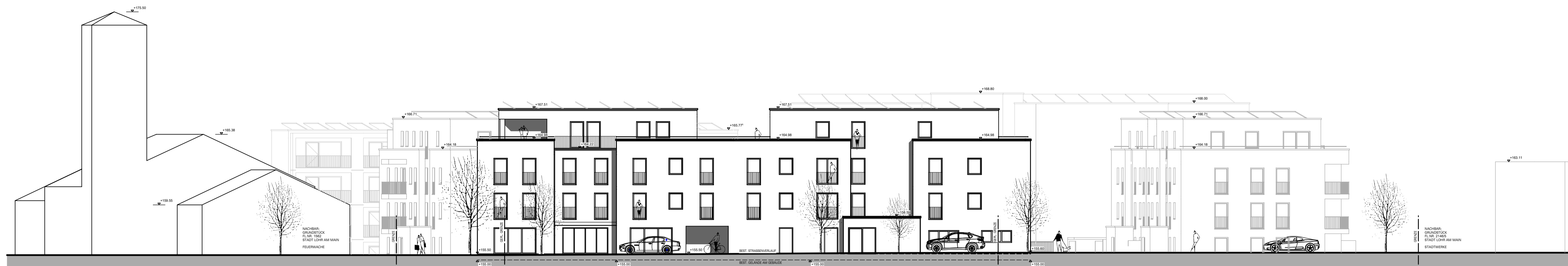
ANSICHT VON WESTEN - GEBÄUDE G2 MIT GEBÄUDE G1+3+5