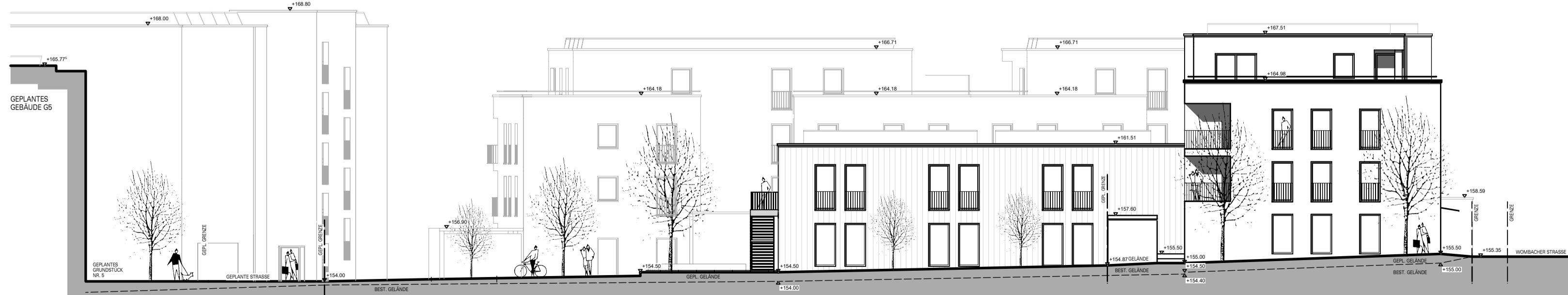
ANSICHT VON NORDEN - GEBÄUDE G2 MIT GEBÄUDE G3+4