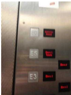
Aufzug von Etage 5 zur Tourist- Information