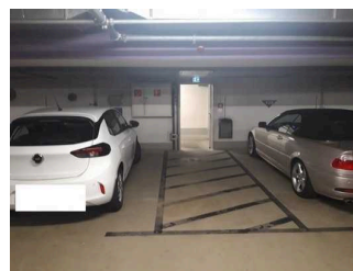
Durchgang 90 cm