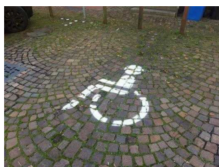
Parkplatz für Menschen mit Behinderungen