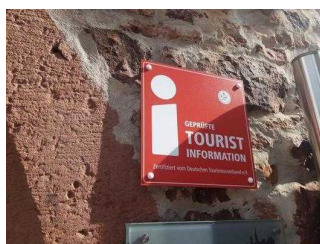
Touristinformation Lohr am Main