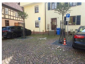
Parkplatz für Menschen mit Behinderungen