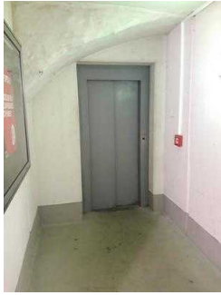
Aufzug von Etage 5 zur Tourist- Information