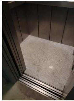
Aufzug von Etage 5 zur Tourist- Information