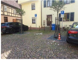
Parkplatz für Menschen mit Behinderungen