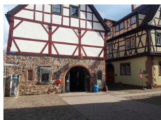
Touristinformation Lohr am Main