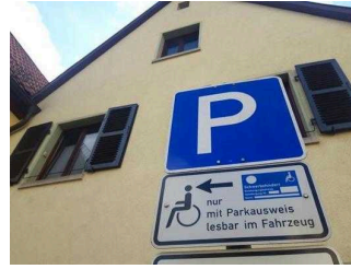
Parkplatz für Menschen mit Behinderungen