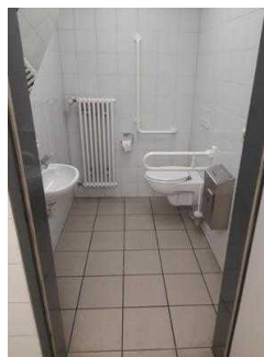
WC-Bereich Parkhaus, Etage 5