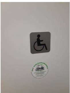
WC-Bereich Parkhaus, Etage 5