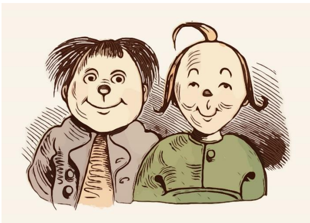
(Max und Moritz von Wilhelm Busch)

Es geht den Veranstaltern dabei um den „Aha-Effekt“ im Publikum, um das freudige Wiedererkennen von zumeist in der Kindheit und Jugend gelesenen Abenteuer-Heftchen, Zeitungs-Comic-Strips oder liebgewonnene Zeichentrick-Ikonen, die für Süßigkeiten oder Spielzeug, aber auch für Kleidung (LURCHI – Salamander-Schuhe) und andere Alltagsdinge Werbung machten.