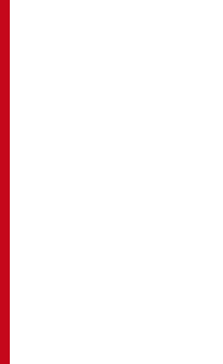
Das Lohrer Stadtwappen