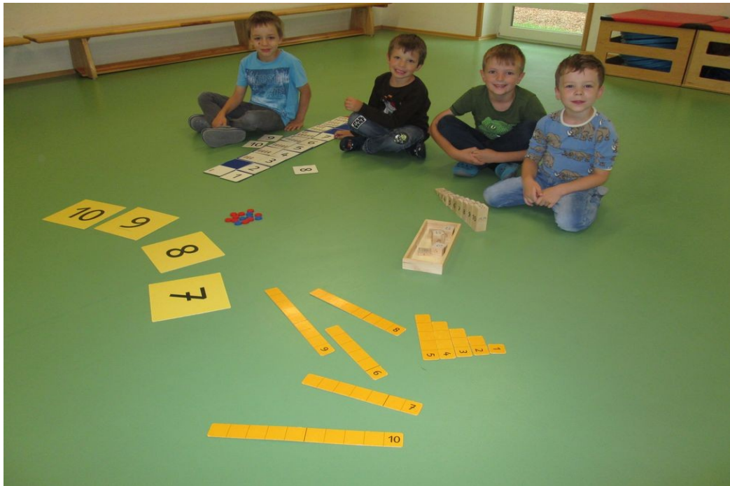
Mathematische Grundprinzipien im Alltag entdecken