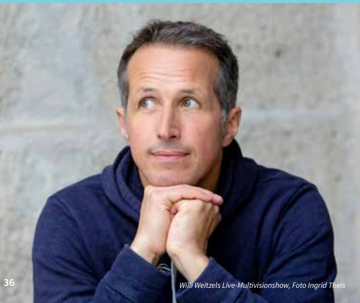
Willi Weitzels Live-Multivisionsshow