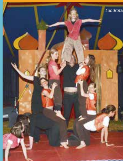
Landratsamt Main-Spessart, Zirkus Ciccolino

Infos & Anmeldung: Kommunale Jugendarbeit, Landratsamt Main-Spessart (Kontakt s. Rückseite)