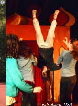
Landratsamt MSP, Zirkus Ciccolino