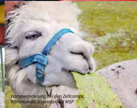
Lamawanderung bei den Zeltcamps, Kommunale Jugendarbeit MSP