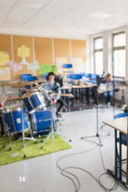
Landratsamt Main-Spessart, Rock & Pop on stage