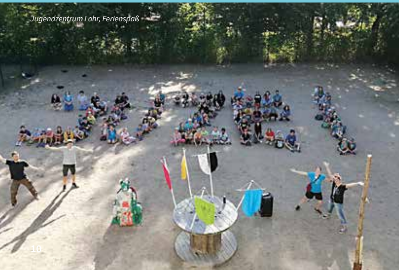
Jugendzentrum Lohr, Ferienspaß