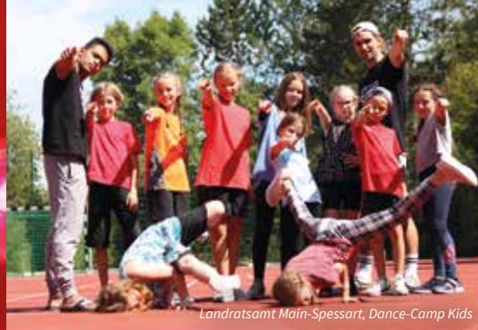
Landratsamt Main-Spessart, Dance-Camp Kids