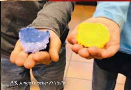
VHS, Junge Forscher Kristalle