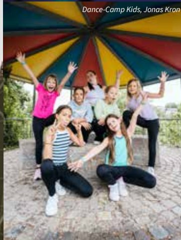
Dance-Camp Kids, Jonas Kron