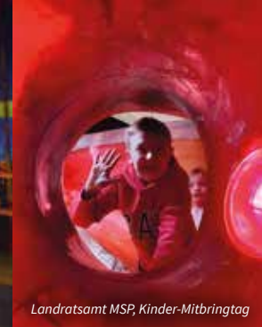
Landratsamt MSP, Kinder-Mitbringtag