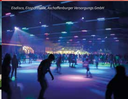
Eisdisco, Eissporthalle, Aschaffener Versorgungs GmbH